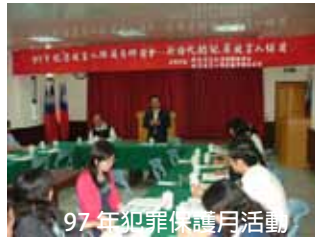
97年犯罪保護月活動