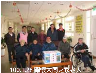
100.1.28 關懷大同之家老人