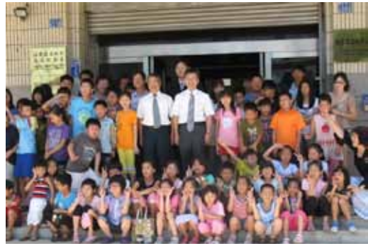
100.7.29 兒童及青少年暑期成長營