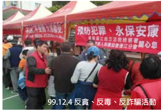
99.12.4 反貪、反毒、反詐騙活動

本會秉持人溺己溺精神，協助因他人犯罪行為為被害或其遺屬，解決其困境，撫平傷痛，重建生活，維護祥和社會福祉為宗旨。