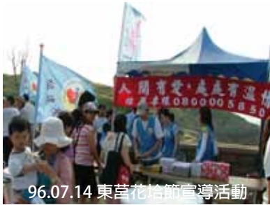
96.07.14 東莒花姑節宣導活動