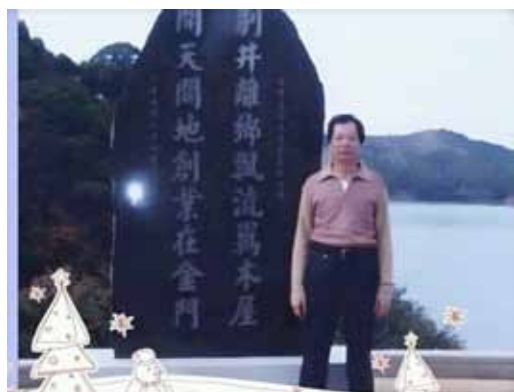
攝於美國的金門大橋