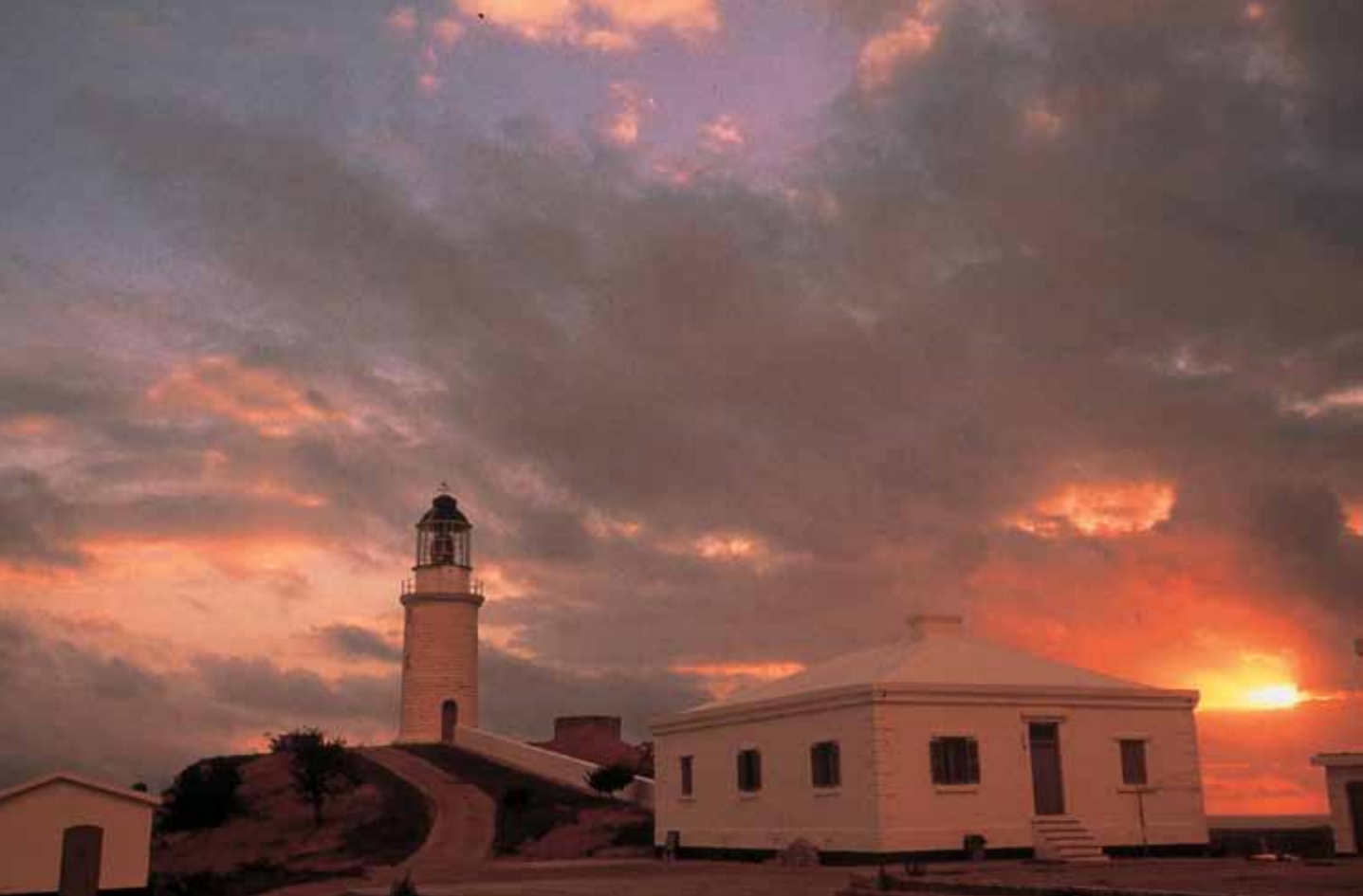
東莒燈塔 / 馬祖國家風景區管理處