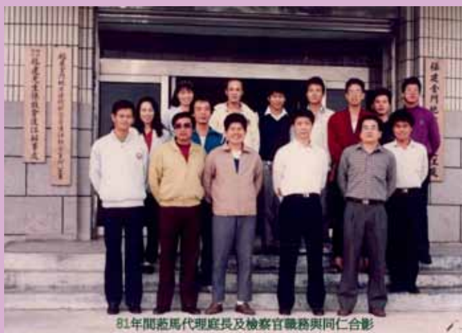
81年間蒞馬代理庭長及檢察官職務與同仁合影

78年底某個冬天的早晨，天空灰濛濛的，十天一航次的運補艦又靠近福澳港了，肅守福澳港