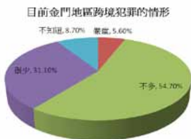
圖七 目前金門地區跨境犯罪的情形

關於小三通可能帶來的跨境犯罪，過半的受訪者認為目前情況不多（詳圖七），其數值呈現如下：認為嚴重的有 9 位 (5.6%)、認為不多的有 88 位 (54.7%)、很少的 50 位 (31.1%)、不知道的 14 位 (8.7%)。