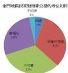
圖十二 金門地區民眾對博弈公投的看法如何

圖十二則是相對討論金門地區的民眾對博弈的看法，覺得同意的比例不多，僅有5% (8人)、有條件同意與不同意的比例相等，各有32% (52人)，而覺得民眾看法兩極化的有28% (45人)，呈現了與受訪者自己看法不同的比例。