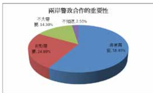
圖八 兩岸警政合作的重要性

但受訪者都相當的認同兩岸警政合作的重要性（圖八）。覺得非常有需要 94 位 (58.4%)、有點需要 40 位 (24.8%)、不太需要 23 位 (14.3%)、不知道有 4 位 (2.5%)。