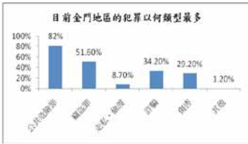
圖二 目前金門地區的犯罪以何類型最多