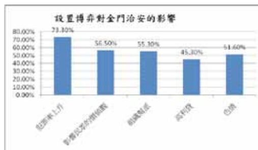
圖十三 設置博弈對金門治安的影響

的受訪者(56.5%，91位)認為會影響民眾的價值觀、以及組織幫派(55.3%，89位)，對於可能帶來高利貸(45.3%，73位)以及色情(51.6%，83位)都是受訪者認為可能引發的問題。