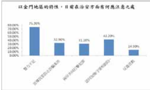
圖十五 以金門地區的特性，目前在治安方面有何應注意之處

(32.9%)，兩岸共同打擊犯罪有 50 位受訪者認同，占比例的 31.1%，認同加強守望相助防制犯罪的受訪者更有多達 68 位 (42.2%)、最後是認為反毒宣教應該要加強的有 24 位 (14.9%) (詳圖十五)。