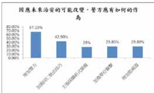
圖十六 因應未來治安的可能改變，警方應有如何的作為

至於因為未來治安的可能改變，警方應該如何的作為則是呼應上題；受訪者最認同的仍為增加警力 (108 位，67.1%)，認為應加強同仁執法技巧的有 69 位 (42.9%)；主張採購新式裝備以因應之的有 45 位 (28%)、認為應該加強單位聯繫的有 48 位 (29.8%)，認為要增加監視器的比例也有 48 位 (29.8%) (詳圖十六)。