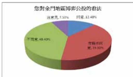
圖十一 您對金門地區博弈公投的看法如何

探詢基層員警對於博弈公投的看法，其中有條件同意及同意的約占半數，分別為39.8% (64人) 及12.4% (20人)，不同意的人佔40.4% (65人)；而沒意見的僅約7.5% (12人) (詳圖十一)。