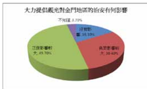
圖十 大力提倡觀光對金門地區的治安影響

對於金門縣致力發展觀光，在圖十也顯示了有將近一半的受訪者同意其可為金門地區的治安的正面效益較大。認為有正面影響的有 80 位 (49.7%)、負面影響的則有 49 位 (30.4%)、認為沒有影響的不多，僅有 29 位 (16.1%)，不知道的為 6 位 (3.7%)。