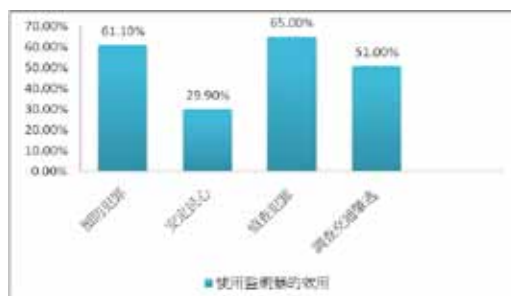
圖九 使用監視器的效用

在現今社會之中，監視器被認為是治安維護的利器，根據圖九，受訪者認為監視器的功用在於預防犯罪、偵查犯罪以及調查交通肇事逃逸上都有其效用存在；其中又以偵查犯罪的功能最為受訪者認同。認為可以預防犯罪的有 96 位 (61.1%)、安定民心的有 47 位 (29.9%)、偵查犯罪的有 102 位 (65%)，以及調查肇事逃逸的有 80 位 (51%)。