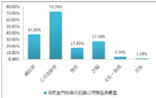
圖三 目前金門地區的何種犯罪類型最嚴重

若是討論犯罪問題最嚴重的則數據如下：竊盜罪 61 位 (37.9%)、公共危險罪 117 位 (72.7%)、傷害 28 位 (17.4%)、詐騙 44 位 (27.3%)、走私偷渡 6 位 (3.7%)、其他的只有兩位 (1.2%)。