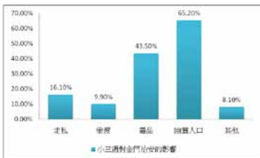
圖六 小三通對金門治安的影響