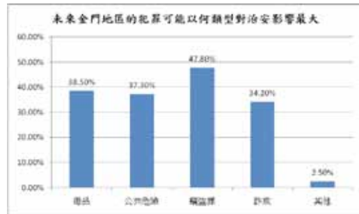
圖四 未來金門地區的犯罪可能以何類型對治安影響最大

由圖四可知，未來對金門治安影響較大的犯罪類型為：毒品 62 位 (38.5%)、公共危險 60 位 (37.3%)、竊盜罪 77 位 (47.8%)、詐欺 55 位 (34.2%) 以及其他 4 位 (2.5%)。