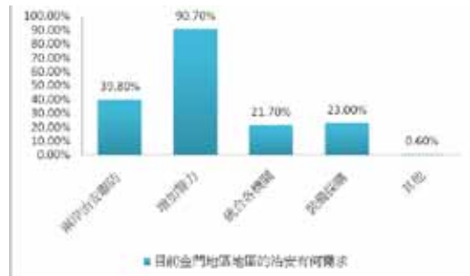
圖五 目前金門地區的治安有何需求

圖五說明了目前金門地區的治安需求性，認為應增加警力的有高達 90.7% (146 位) 受訪者，其次為兩岸治安聯防有 64 位 (39.8%) 選擇，接下來為認為應增加裝備採購的有 37 位 (23.0%)，統合各機關有 35 人 (21.7%) 選擇。