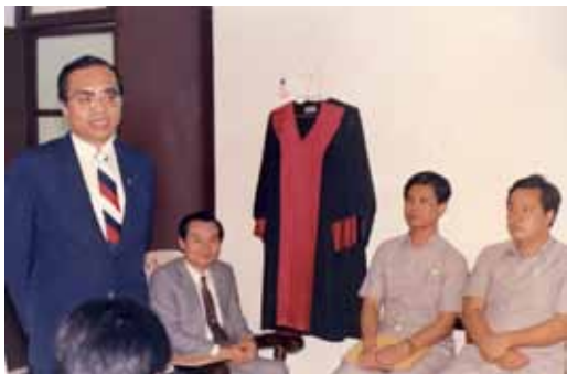
民國 77 年 7 月 1 日 連江司法大樓議價發包事宜

監察院受理人民陳情案件一個月大概一千六百件左右，這些案子的來源，監察院設有人民陳情中心，民眾可以來這裡陳情。其次監察委員地方巡察時接受人民的陳情，或者民眾也可以用書面寄來。對於人民陳情案件，如果這個案件在司法機關，在審判中或偵查中，或是在行政機關處理中的案件，我們不予處理，因為監察院的重點在事後的監督，是否依法行政。在受理陳情案件中，最多的是內政類案件，包括土地徵收、土地重劃、平均地權、土地重測這些土地問題，可能是台灣寸土寸金，所以這一方面的糾葛較多，大概佔有 28%；其次是司法類的，大概佔 22%，為什麼司法案件這麼多？是不是表示司法敗壞，也不能這樣說，因為不管民、刑事，以民事來講你不是敗訴就是勝訴，敗訴的人也會講司法不公，那刑事案件可能就是被告人家或被告，你沒有告成，也是認為檢察官不公，那這樣如果檢察官把你起訴，你又批評這個檢察官不公正，到司法審判也是一樣，因為本來民刑事案件，當事人是對立的，這是一個原因；另外民眾常誤解，