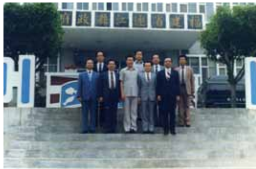
民國 77 年 7 月 1 日