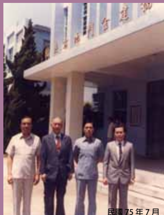
民國 75 年 7 月