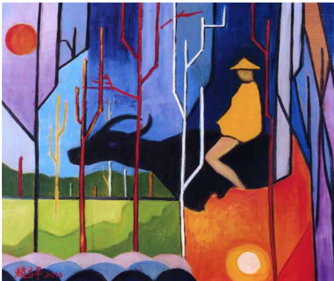
快樂的牧童 / 趙昌平