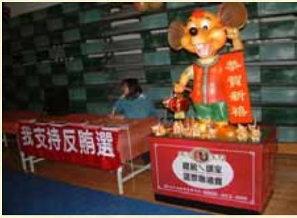
97年元宵節花燈反賄選