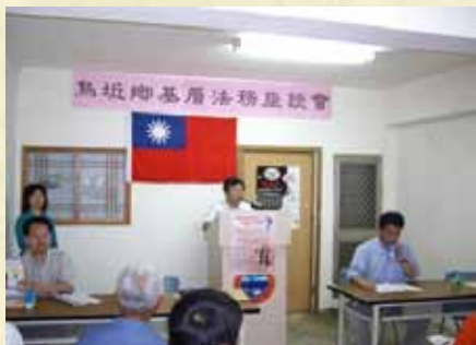
張前檢察長文政親赴烏坵 舉辦法務座談會