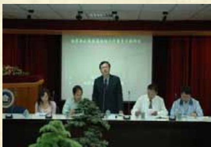
97年檢警調政風加強肅貪聯繫會議