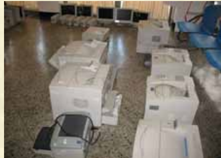
財產報廢公開拍賣