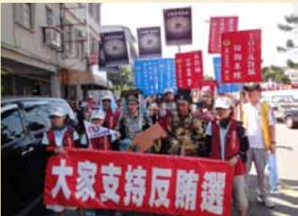
99年參加迎城隍遊行活動反賄選