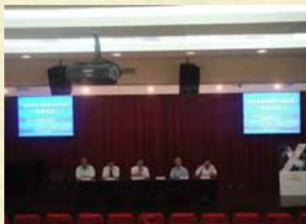
無毒有我影片宣導