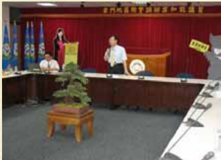
辦理檢警調辦案知能講習