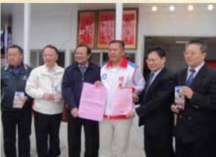
100年拜訪候選人反賄選