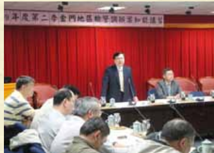
辦理檢警調辦案知能講習