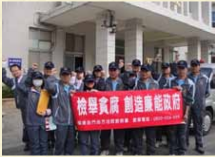
反貪腐，創造廉能政府宣導