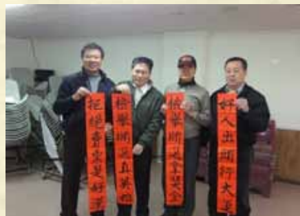
100年贈送春聯宣導反賄選