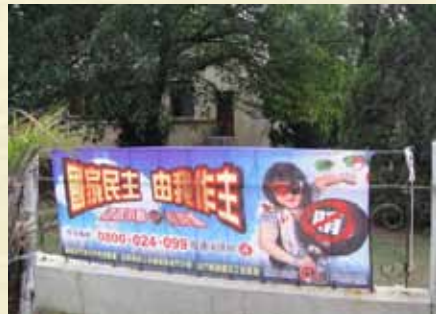
100年反賄選宣導布條