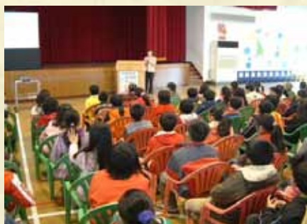
席時英檢察官校園法治教育