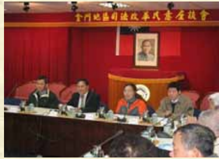
辦理司法改革民意座談會