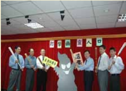
98年查賄打擊幽靈人口