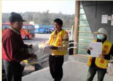
98年動員社會勞動人反賄選