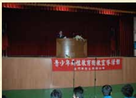
陳前檢察長宏達親赴校園法治教育