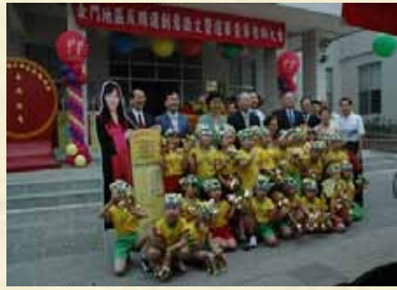
98年反賄選誓師大會