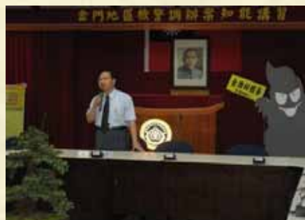
辦理檢警調辦案知能講習