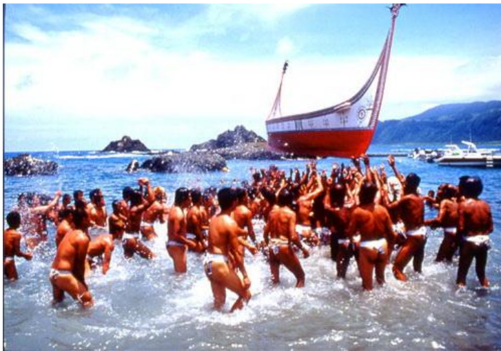
(世新大學-黃正德 94)(中華民國交通部觀光局-拍攝者賴國用)

蘭嶼距臺東東南外海四十九海浬，蘭嶼隸屬臺東縣，為臺灣東南方的古老火山島嶼。為臺灣第二大附屬島嶼，面積約為 48 平方公里，是臺灣地區除恆春半島以外，唯一有熱帶雨林生長之島嶼(內政部營建署 1989)。