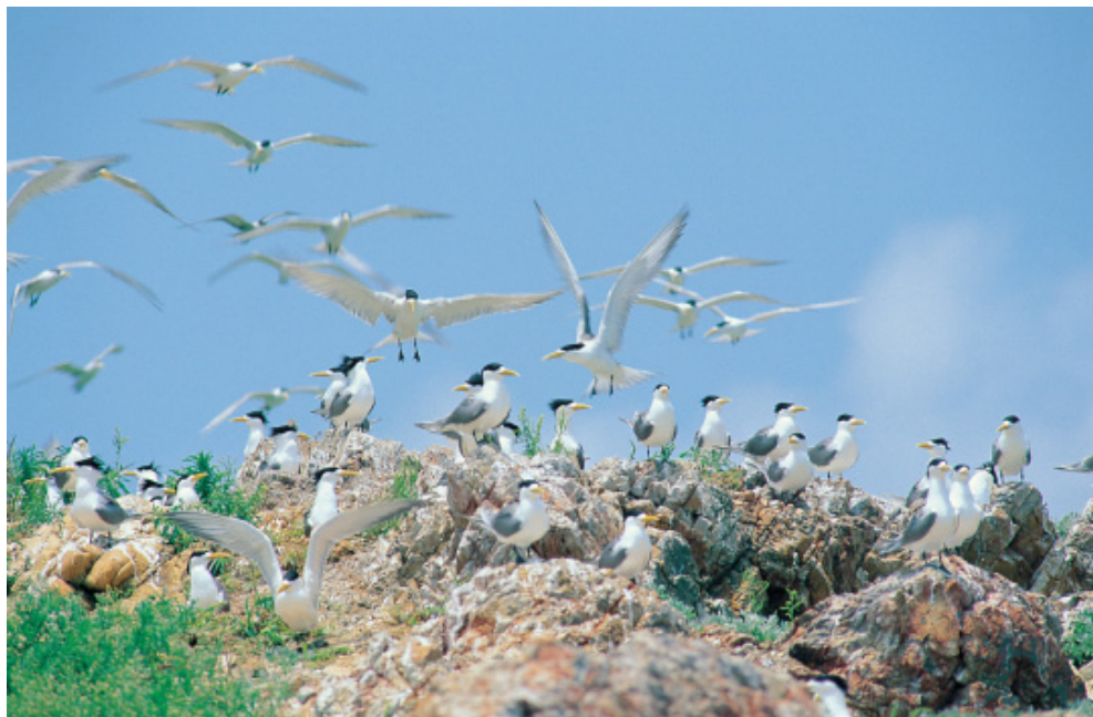
鳳頭燕鷗