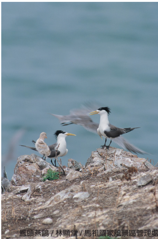
鳳頭燕鷗